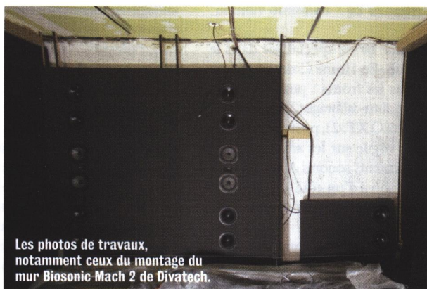
Les photos de travaux, notamment ceux du montage du mur Biosonic Mach 2 de Divatech.