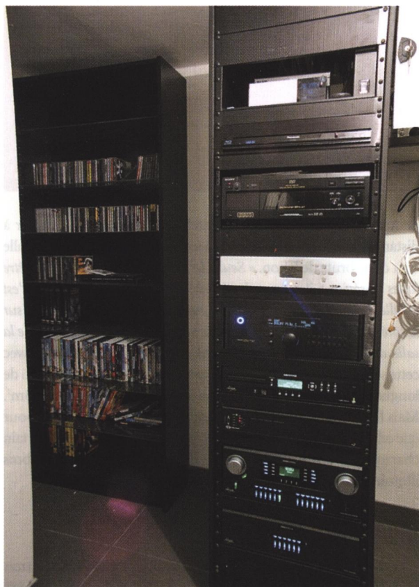
Le rack Middle Atlantic est installé dans une petite pièce située derrière l'écran.